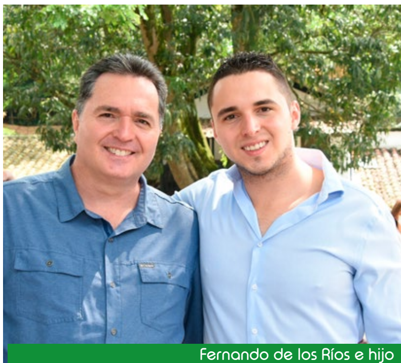
Fernando de los Ríos e hijo