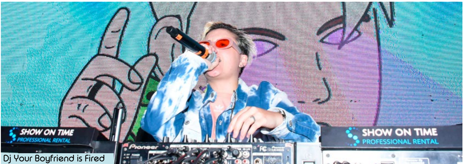
Dj Your Boyfriend is Fired