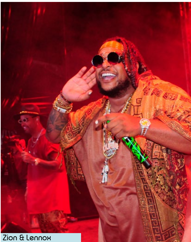
Zion & Lennox