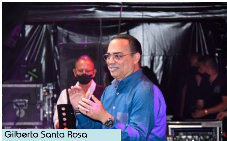
Gilberto Santa Rosa